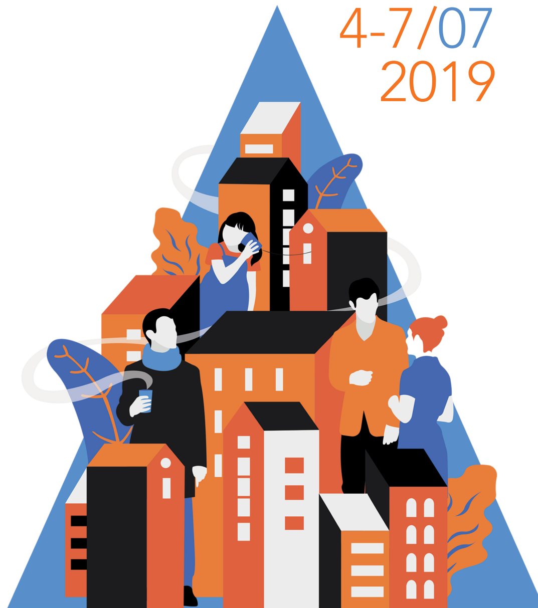
Illustrazione di Anna Formilan